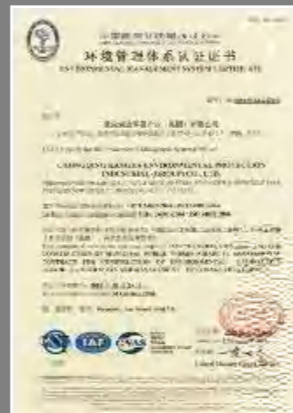
環境管理體系認證證書

公司緊跟國內外環境政策和環保趨勢，將保護環境視為自身企業社會責任的主要內容之一。在日常營運當中，我們秉承康達國際的環境方針：「遵章守法、節能降耗、達標排放、清潔生產、持續改進、綠色發展」。公司制定下發了《環境、職業健康安全檢查制度》、《環境因素、危險源識別評價管理制度》，規定內容包括安全管理制度及環保管理制度，公司上下統一執行，成功通過 GB/T 24001 /ISO14001 體系認證。